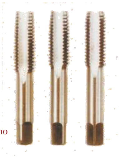
Maschi a mano

Filettatura metrica ISO a passo grosso in acciaio al cromo-vanadio