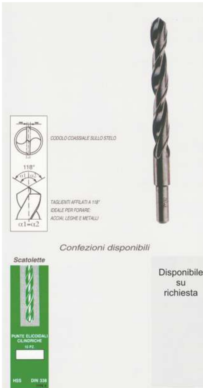
Punte elicoidali con codolo cilindrico