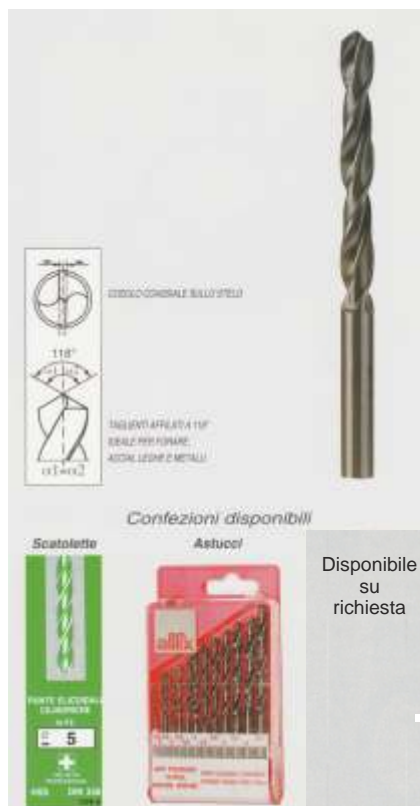
Punte elicoidali con codolo cilindrico

Disponibili anche con Espositore da banco per negozi Art. P2019915 Pz. 850 € 496,60